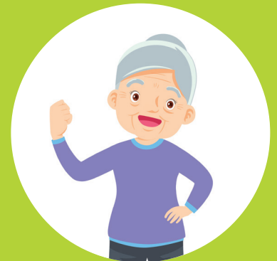
Zelfstandig oefeningen herhalen