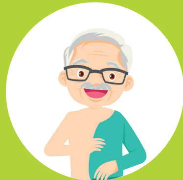
Zelfstandig aan- en uitkleden