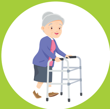
Zelfstandig mobiliteit verbeteren