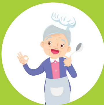
Zelfstandig eten (voor)bereiden